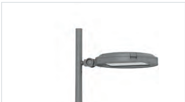
Tsana X Track