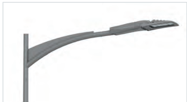
Tilt T Prima