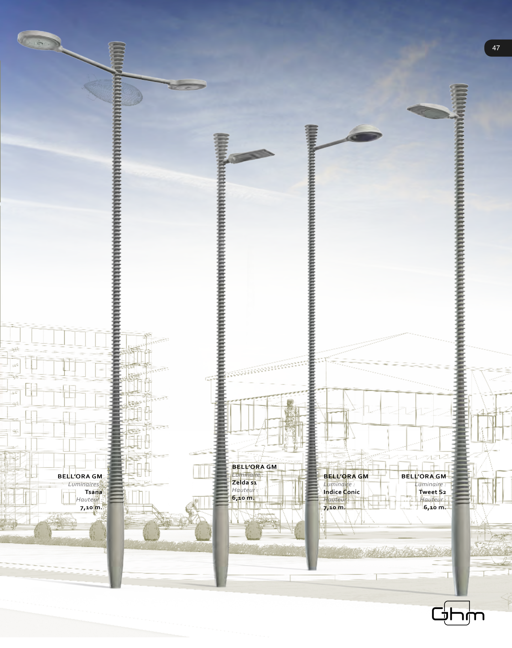
BELL'ORA GM Luminaire : Tsana Hauteur : 7,10 m.