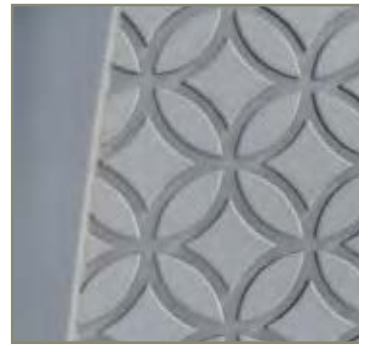
motif du mât VEI

contre-feu décalé (hauteur 3.5 m, 4 ou 5 m)