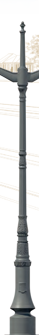
TARN Bouquet : Forum Luminaires : Beauregard II Hauteur : 3,82 m.