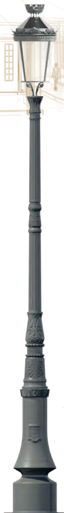
TARN Luminaire : Chenonceaux II Hauteur : 3,41 m.