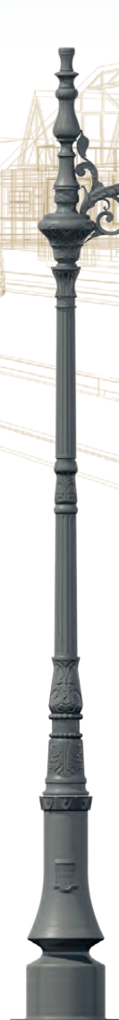
TARN Bouquet : Chantilly Luminaire : Elsy Hauteur : 3,88 m.