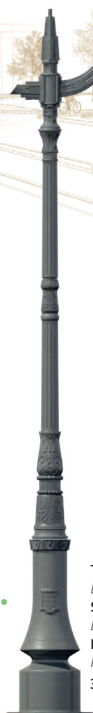
TARN Bouquet : Saumur Luminaire : Perle Hauteur : 3,94 m.