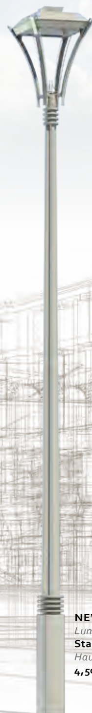
NEWYORK Luminaire : Stanza Hauteur : 4,50 m.