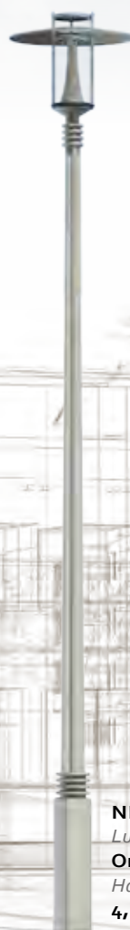
NEWYORK Luminaire : Orientis Hauteur : 4,50 m.