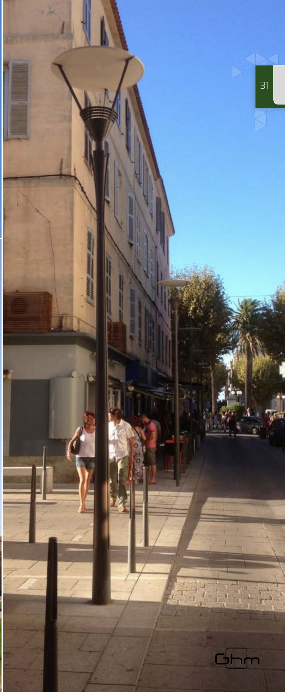
• Luminaire LED ou disponible en version LED.