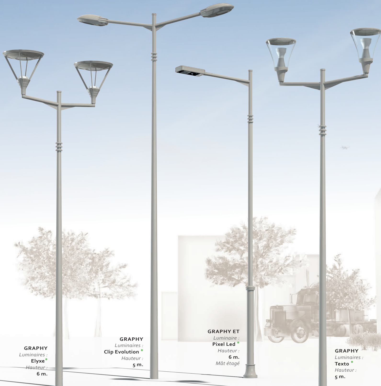
GRAPHY Luminaire : Elyxe Hauteur : 6 m.