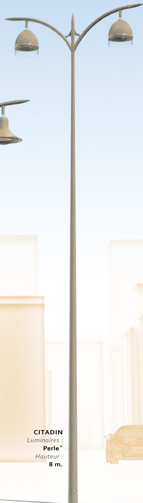
CITADIN Luminaires : Perle Hauteur : 8 m.