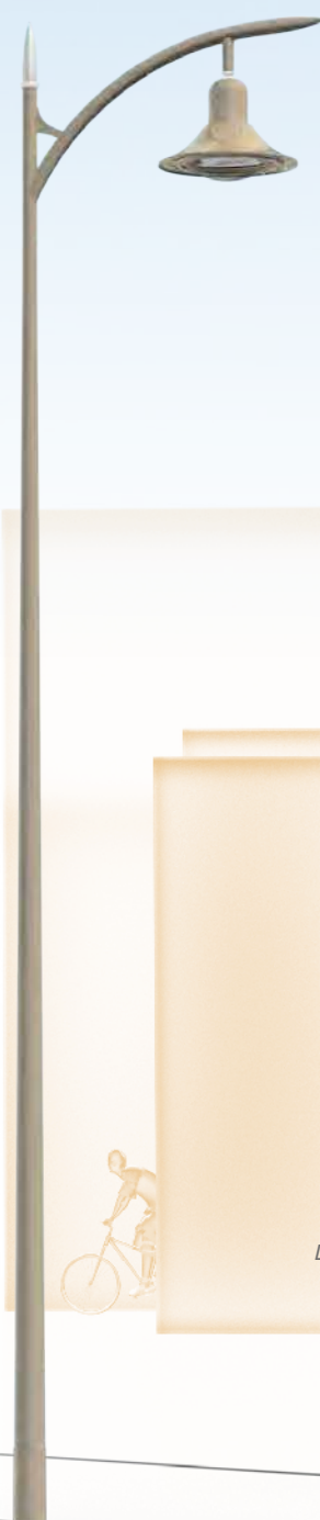
CITADIN Luminaire : Odélia Hauteur : 6 m. Option : pointe lumineuse