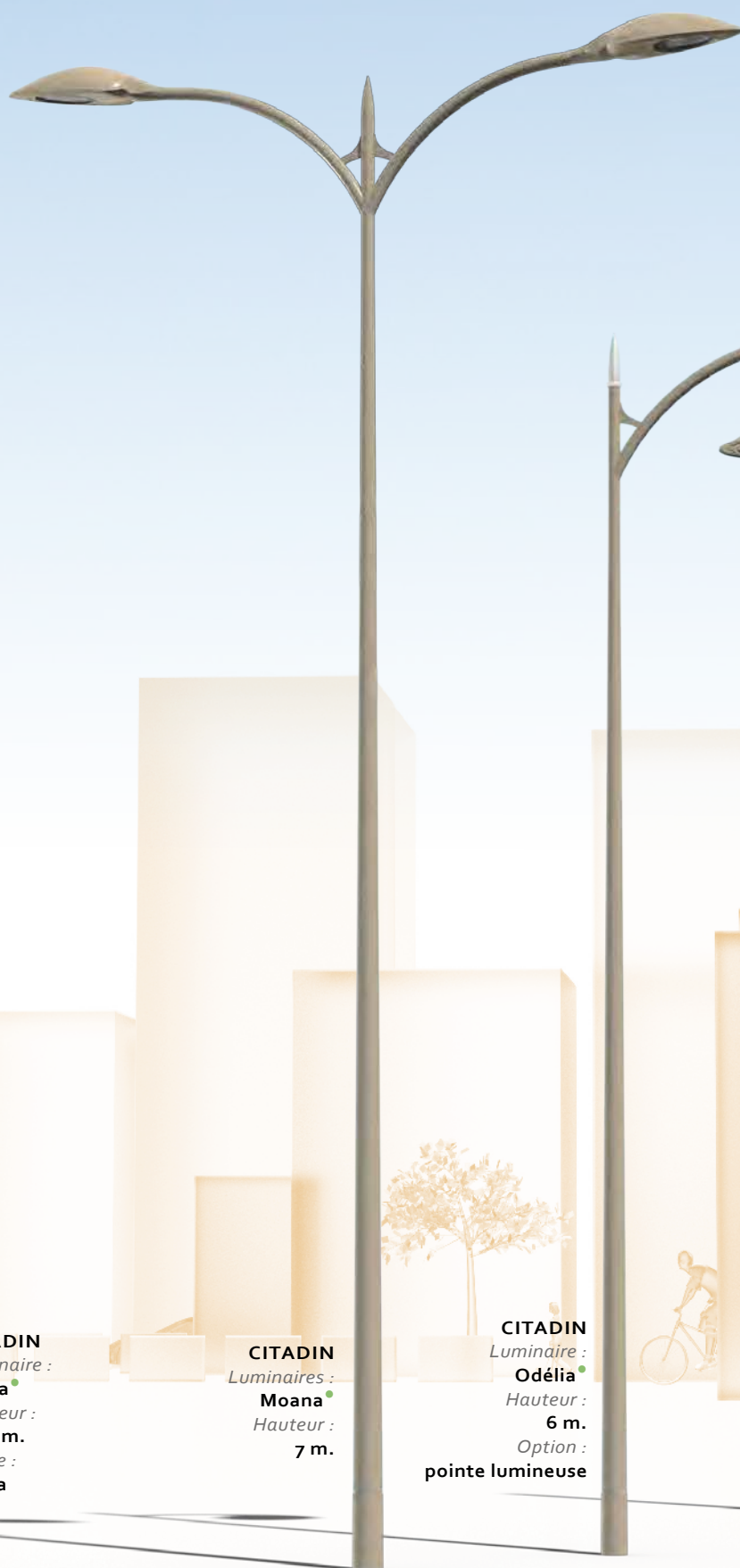
CITADIN Luminaires : Moana Hauteur : 7 m.