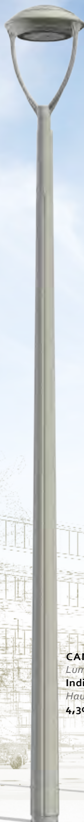
CANDIS Luminaire : Indice Hauteur : 4,30 m.