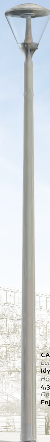
CANDIS Luminaire : Idylle Hauteur : 4,30 m. Option : Enjoliveur de pied