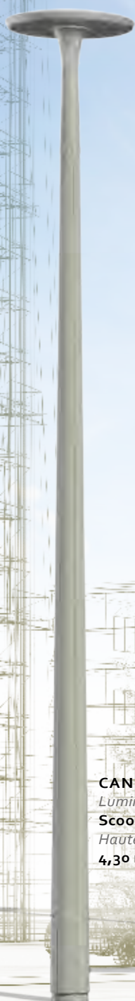
CANDIS Luminaire : Scoop Kea Hauteur : 4,30 m.