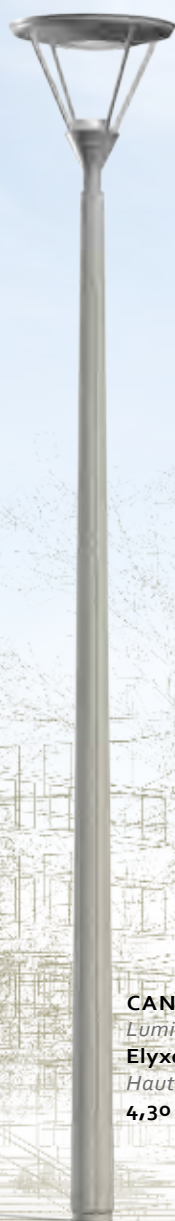
CANDIS Luminaire : Elyxe Hauteur : 4,30 m.