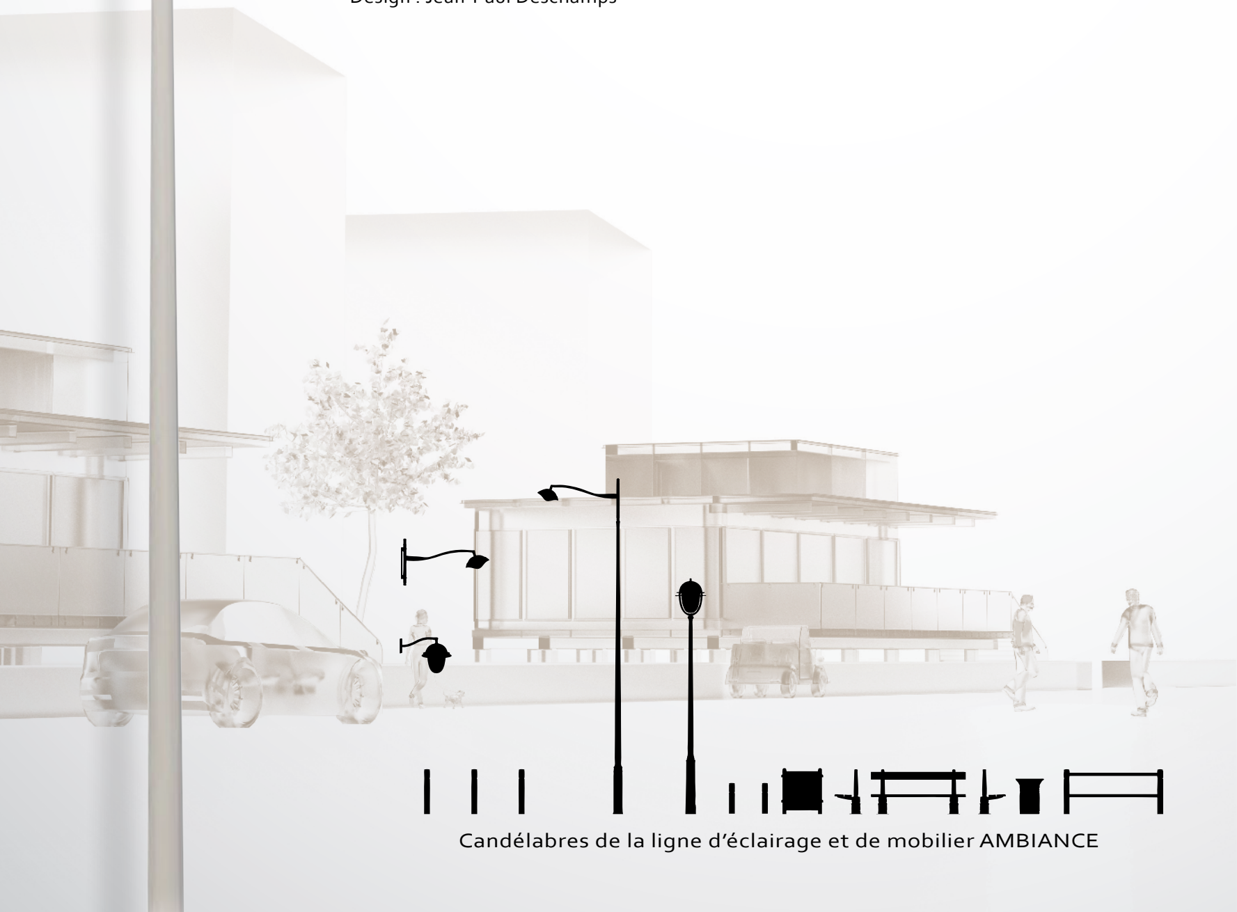
Candélabres de la ligne d'éclairage et de mobilier AMBIANCE