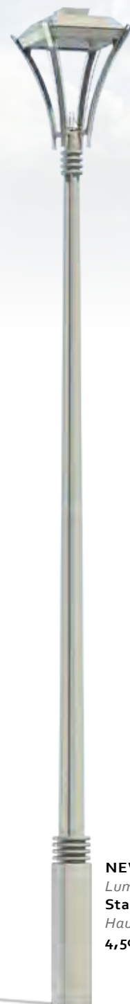
NEW YORK Luminaire : Stanza Hauteur : 4,50 m.