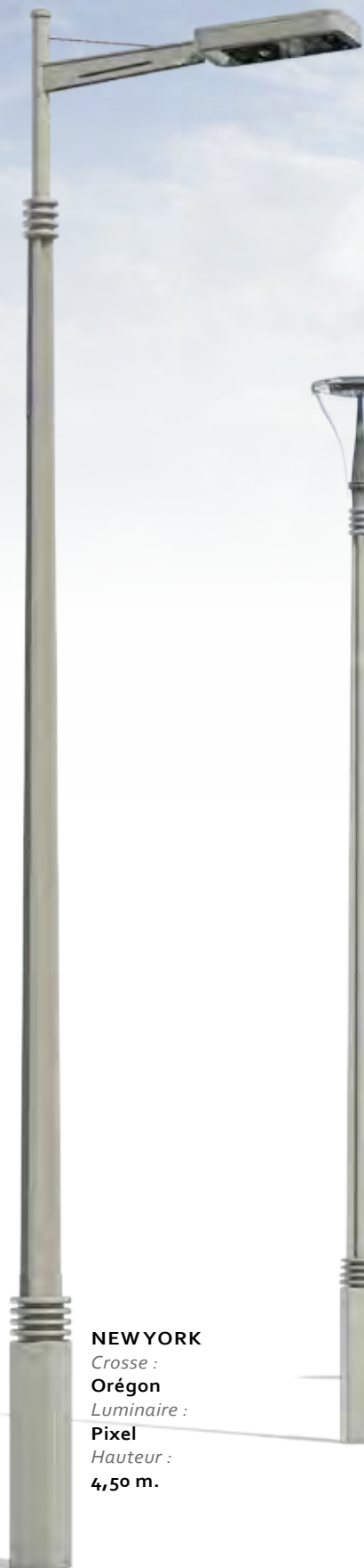
NEW YORK Crosse : Orégon Luminaire : Pixel Hauteur : 4,50 m.