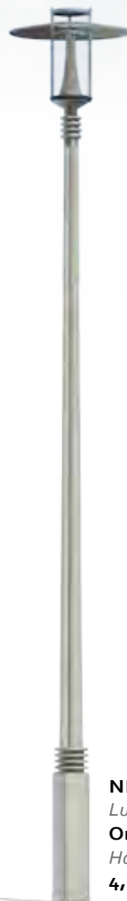
NEW YORK Luminaire : Orientis Hauteur : 4,50 m.