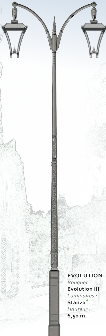
EVOLUTION Bouquet : Evolution III Luminaire : Stanza Hauteur : 6,50 m.