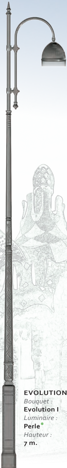
EVOLUTION Bouquet : Evolution I Luminaire : Perle Hauteur : 7 m.