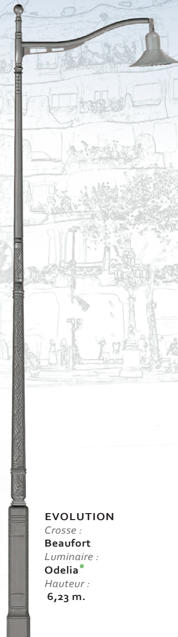
EVOLUTION Crosse : Beaufort Luminaire : Odelia Hauteur : 6,23 m.