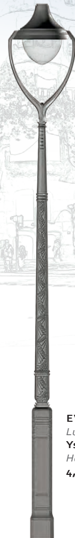
EVOLUTION Luminaire : Ysalis Lyre Hauteur : 4,29 m.