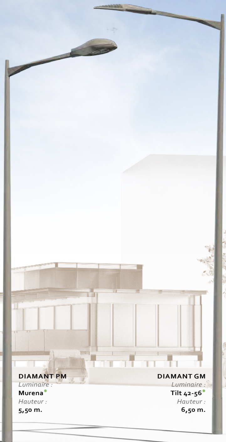
DIAMANT PM Luminaire : Murena • Hauteur : 5,50 m.