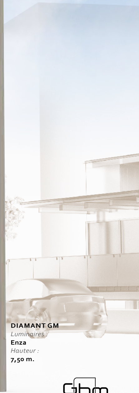
DIAMANT GM Luminaire : Enza Hauteur : 7,50 m.