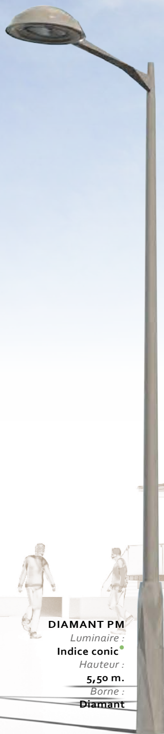
DIAMANT PM Luminaire : Indice conic • Hauteur : 5,50 m. Borne : Diamant