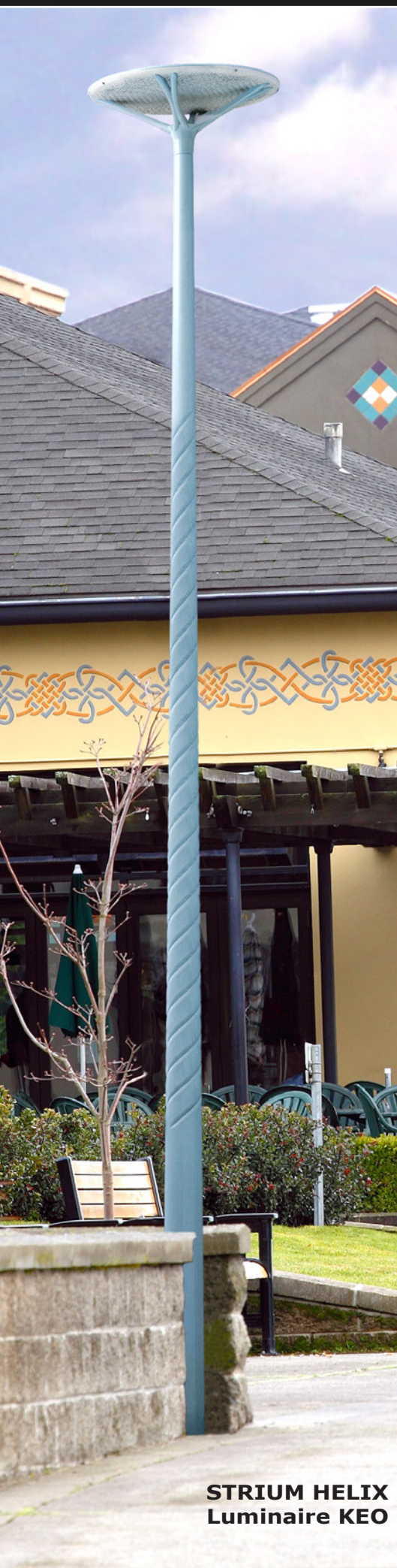
STRIUM HELIX Luminaire KEO